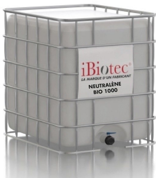
Περιέκτης GRV 1000 L