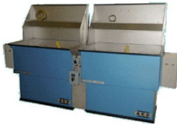
Δεξαμενές θερμής ή ψυχρής εμβάπτισης