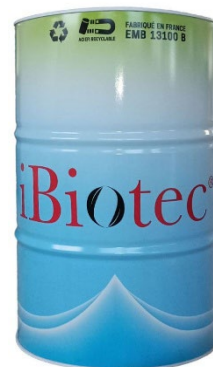
Βαρέλι 200 L